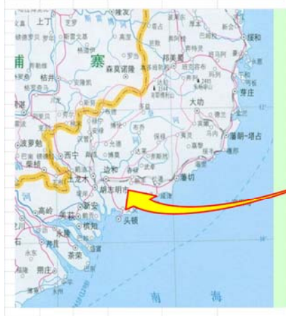
(2016 年海外企業實習企劃行程表)