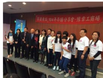
(新北市政府教育局暨高中職校園演說)