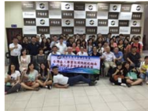
(參訪胡志明市經濟大學、RMIT 大學、平陽商會)