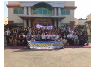
(參訪胡志明台灣學校、今立塑膠工業)