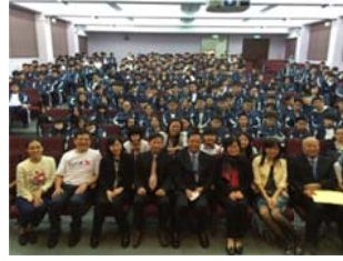
(高雄市政府教育局暨高中職校園演說)