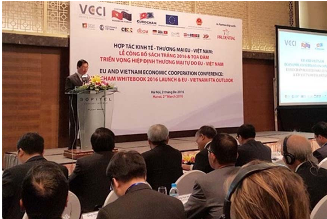
2016 年越南貿易投資白皮書公佈儀式。

（西貢解放日報）歐盟駐越南商會 3 月 2 日在河內舉行儀式，公佈 2016 年越南貿易投資白皮書，並向歐盟駐越南企業界提出建議。