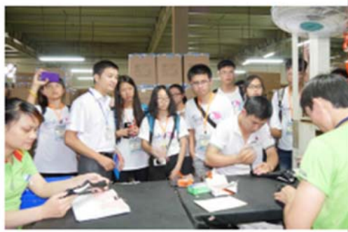
學生參訪團密集參訪不同行業別的越南臺商工廠，了解實地作業狀況。