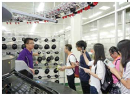
透過實地參訪，新住民二代越南參訪之行收穫滿滿。