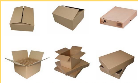
圖:和唐責任有限公司製作紙箱

有了朋友的陪伴，能夠互相督促並給予勇氣，與獨自踏出舒適圈時所需要面對的恐懼相比減少了許多，因為多了一